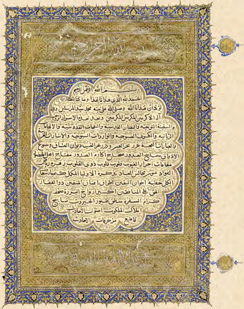
Dîvân-ı Kebîr (770/1368) (Mevlâna Müzesi Kütüphanesi, No: 68, 462x320 mm., c. I, 153 vr., 3 b )